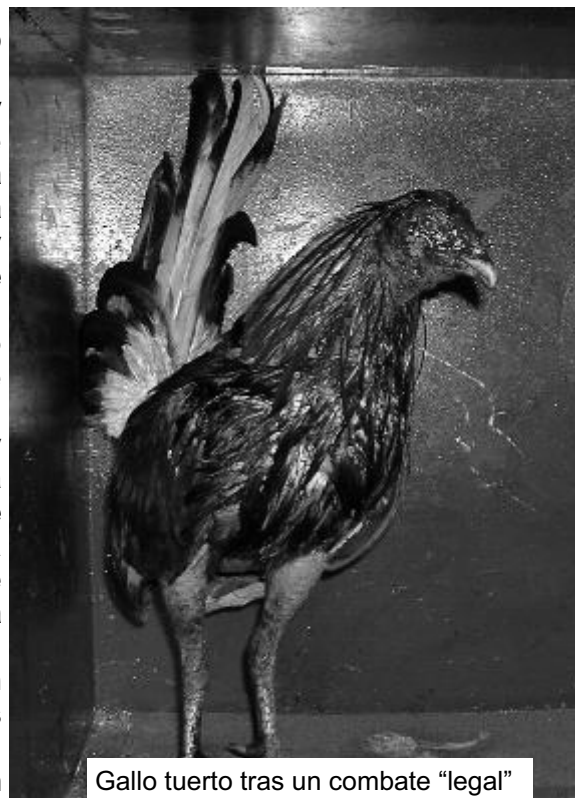
Gallo tuerto tras un combate "legal"