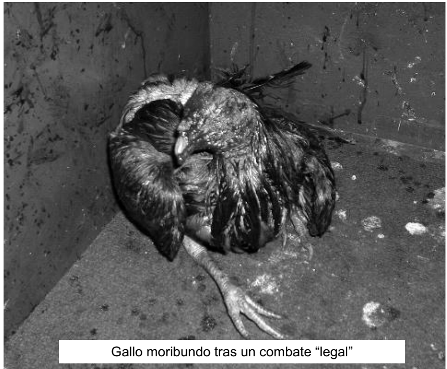
Gallo moribundo tras un combate "legal"

A la vista de la citada Resolución, en Asanda entendimos que sus disposiciones vulneraban gravemente el espíritu y la letra de la Ley 11/2003, por lo que en mayo de 2006 (justo cuando tuvimos conocimiento accidentalmente de su promulgación, pues no fue publicada ni nos fue comunicada) nos dirigimos a la Consejería de Presidencia solicitando su derogación y sustitución por otro texto que se adecuara tanto a la Ley 11/2003 de Protección de los Animales como a la Ley 13/1999 de 15 de diciembre