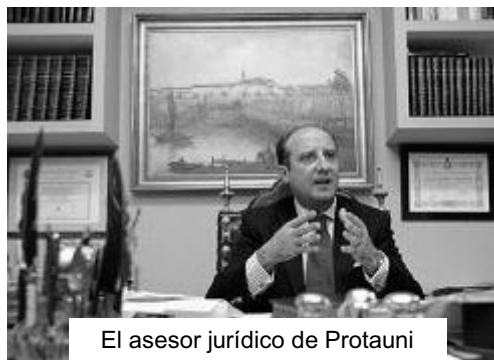
El asesor jurídico de Protauni