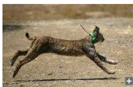
Una hembra de lince ibérico soltada en la zona de Guadalquivir. José Martínez

La zona del Guadalquivir ha sido uno de los espacios seleccionados para los trabajos de reintroducción del lince ibérico. Esta zona del norte de la provincia reúne las características necesarias para que este felino pueda reproducirse: es un área cercana a Cardeña-Andújar -lo que facilita la comunicación natural entre zonas de reintroducción- y se trata de una superficie con altas densidades de conejo, único alimento del lince ibérico.