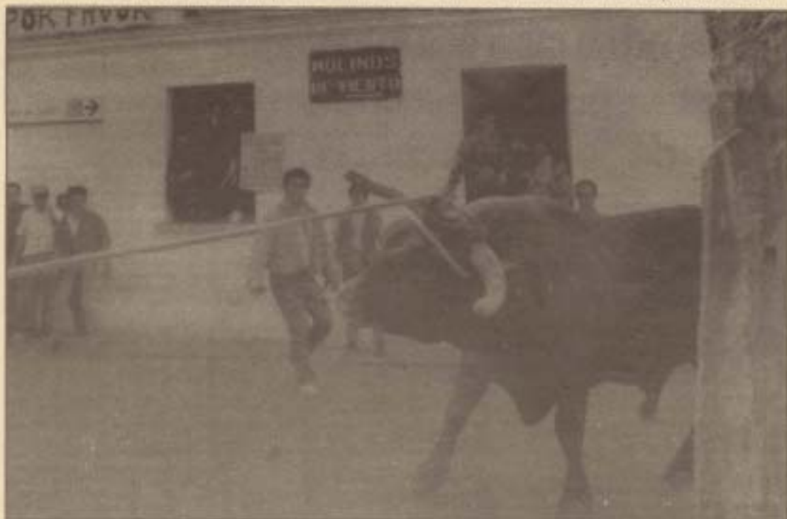
El «Toro Embolao», en Arcos, que suele causar heridas graves, se acorrala y apalea; a pesar de los carteles que piden que sea respetado.

Los malos tratos a animales se presentan a veces como tradición y cultura, movidos por el jolgorio y la mofa. Muchos de esos espectáculos están prohibidos porque no acaban con el sacrificio del animal, pero la autoridad, en ciertos casos, hace la vista gorda.