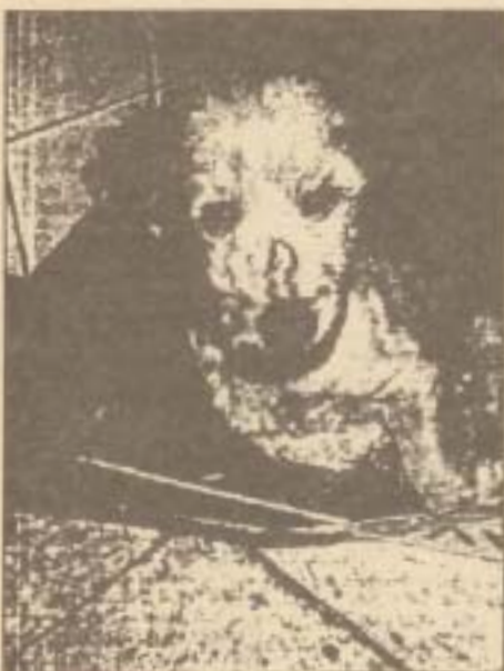
FUEGO CONTRA EL MOQUILLO. El cachorro de la imagen, ciego, fue recogido en la calle y llevado a la Protectora. Pudo quedarse ciego tras padecer el moquillo, el cual más de uno talavia cree que se puede curar quemándole el hocico al animal, como ocurrió con éste. Hubo que sacrificarlo.

Ante esta situación, la presidenta de Asanda asegura que sólo queda luchar desde el principio, exigiendo especialmente en la educación de los niños. Sólo así podrían evitarse imágenes como las que acompañan estas líneas.