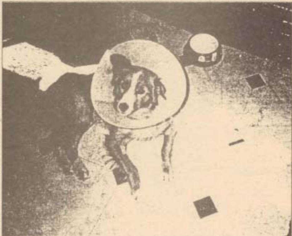
CON UN BATE DE BEISBOL. El animal de la imagen presenta en la actualidad semejante aspecto después de que fuera agredido con un bate de béisbol. Abandonado, comenzó a ser cuidado por varias personas que viven en el barrio por el que vagabundaba. Hasta que un vecino empezó a darle que le atravesó el pecho, se hizo con un bate de béisbol y se fue tras el perro. Un año que hizo de evitarlo fue amenazado por el agresor, que le comenzó a quitarle de allí miedo. Hondo, el animal se acordó. Cuando volvió, algo más recuperado, le cogió la pata trasera y presentaba numerosas heridas.