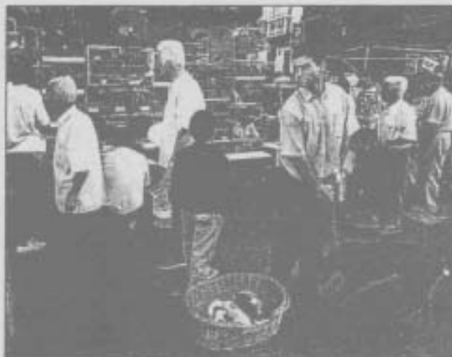
Los animales domésticos, deben disponer de cartilla sanitaria y contar con tres meses de edad para poder ser vendidos

se considera ilícita la venta de aves consideradas como de abasto, así como la de especies protegidas. Además, la ley establece para la venta de los animales de compañía que tengan más de tres meses de edad y posean la adecuada cartilla sanitaria que acredite su vacunación y su estado de salud. A pesar de todas las denuncias producidas no hay una vigilancia continuada en la zona.