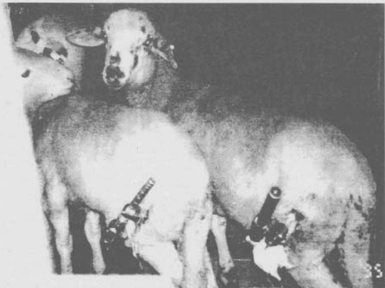
PRUEBA Los responsables de Asanda han facilitado esta foto como prueba de los experimentos quirúrgicos realizados con corderos en Virgen del Rocio

18 DIARIO16 ANDALUCIA Sábado 16 Diciembre 1995