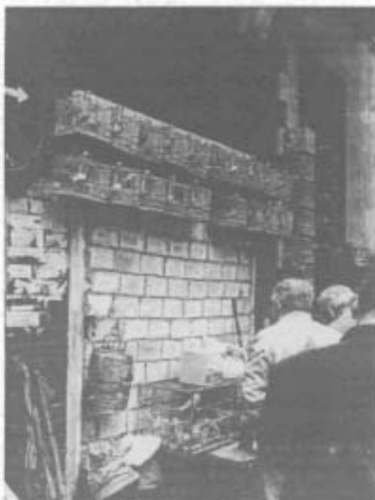
Mercadillo de la Alfranca.

(*) Asociación Andaluza para la Defensa de los Animales (ASANDA).