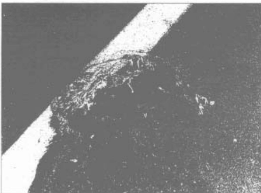
Los restos de un perro atropellado yacen en la acera de Torredonjimeno (Jaén) cuando los magistrados del Juzgo que pide la municipalidad de Jaén a pasar por encima.