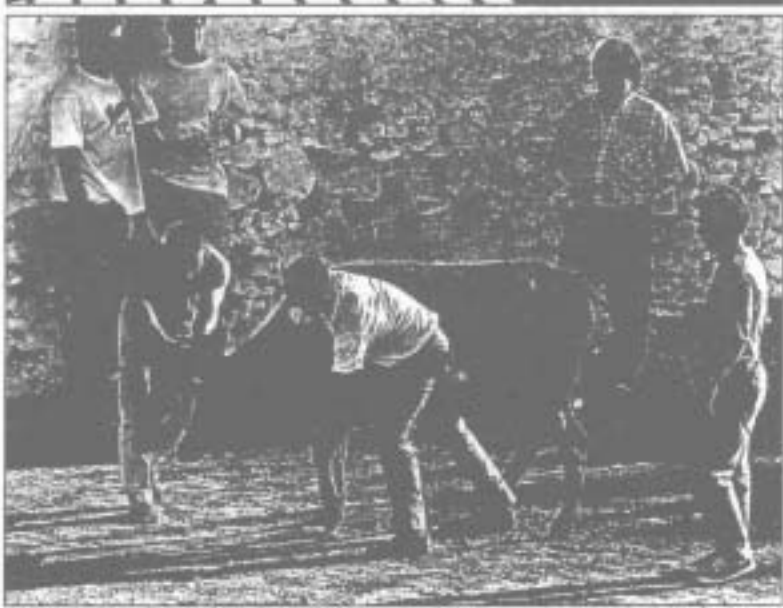
Ambos, especies protegidas incubadas en el puerto de Algeciras. Abajo, fiesta con vacillas en Arocha (Huelva).

tividad, pero se especifica que las matanzas sólo deberán ser para consumo propio.