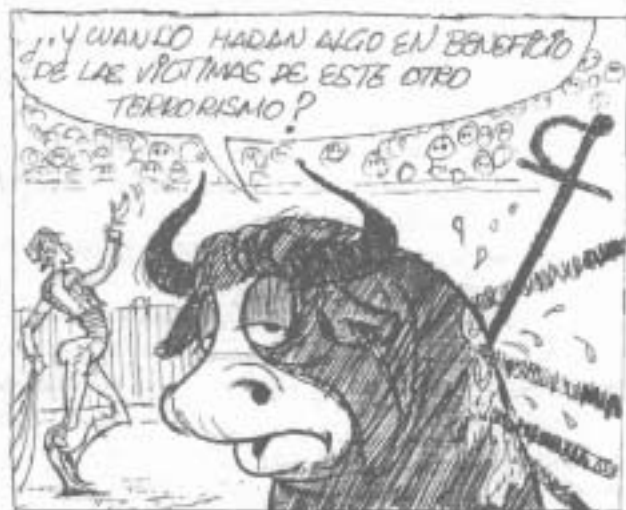
DIBUJO: ISMAEL CHIRON

Tras estas gestiones, el delegado de Salud de Huelva informa que: "en la próxima campaña incidiremos especialmente con los veterinarios en el control de las matanzas domiciliarias y el aturdimiento de los animales antes del sacrificio".