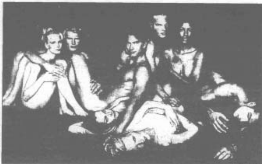
Varios modelos de la agencia Boss Models, en una de las escenas de la campaña Vuélvete la espalda a las pieles .

La defensa de los animales va a tener desde mañana unos originales paladines, según ha informado el dominical británico Independent on Sunday . La sociedad People for the Ethical Treatment of Animals, PETA (Gente a Favor de un Trato Ético a los Animales), lanza una campaña contra la comercialización de las pieles. Pero esta vez tiene un aliado inesperado, una de las primeras agencias mundiales de modelos, Boss Models, que en otros tiempos participó en numerosos desfiles de peltería. La campaña, bajo el título Vuélvete la espalda a las pieles , va a presentarse de forma espectacular. Mañana, los medios de comunicación serán invitados a un lugar secreto, pero situado al aire libre, en el