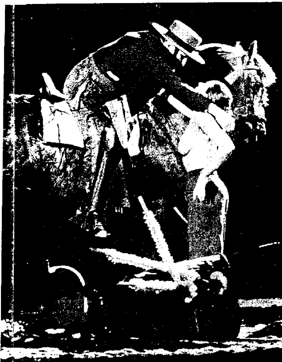
Fotografía de archivo de una función de Carmen en Tarragona.

Una de las medidas que reclamará Asanda será la exclusión de los ganaderos de toros de los beneficiarios de las ayudas de la Unión Europea para incentivar la ganadería extensiva.