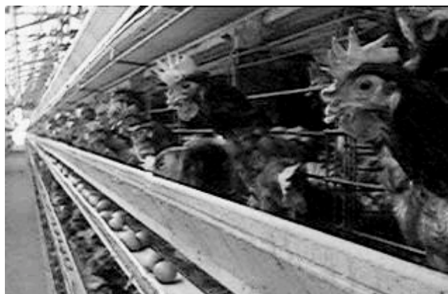
Producción en jaulas

Lo primero que debemos hacer es informar de este asunto del mercado a todos nuestros conocidos, ya que parece que las autoridades de consumo no están por la labor de hacerlo ellas. Lo segundo es insistir continuamente, ante los encargados de las hueverías, sobre nuestro deseo de adquirir huevos NO marcados con el “3”. Al principio es posible que ni siquiera sepan de qué va el asunto del mercado, pero con la insistencia de muchos clientes terminarán pasando nota a los encargados de compras, que a su vez buscarán proveedores diferentes para cubrir la demanda. Lo tercero es, que cuando finalmente encontremos huevos del “1” o del “0” los adquiramos a pesar de que su precio será bastante más elevado que los del “3”. Pensemos en lo que lleva aparejado la producción de “cría en jaula”, y que sólo aumentando la demanda de los de “cria campera” podremos lograr el aumento de la oferta y precios más asequibles.