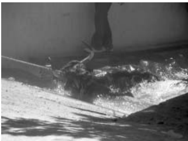
Unas de las reses es arrastrada y sacada casi ahogada del río en Beas

Las fiestas de san Marcos las venimos denunciando desde hace años, aunque Gobernación siempre archiva las denuncias al, según dicho Organismo, no coincidir lo denunciado con lo que las fuerzas de orden público recogen en sus actas: en cuanto comienzan los festejos, la policía local se ausenta del recinto y, por su parte, los agentes de la guardia civil quedan situados lo suficientemente lejos como para no poder observar lo que sucede con las reses.