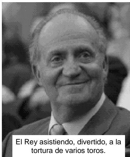
El Rey asistiendo, divertido, a la tortura de varios toros.