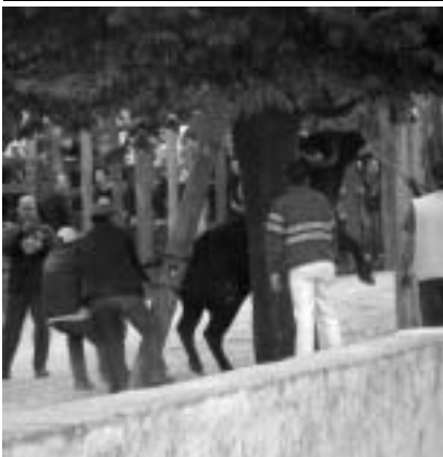
Un toro es colgado de un árbol en los festejos de Beas. Ver página 5

La predilección de los diputados sevillanos ..... 5