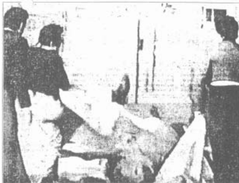
En la imagen puede verse cómo una de las reses recibe una patada por parte de un novillero.