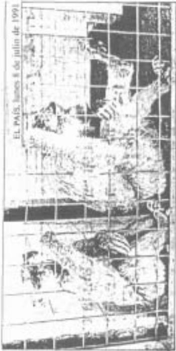
EL PAÍS, lunes 8 de julio de 1991.

Existe un borrador de Ley de Protección Animal, que la Agencia de Medio Ambiente ha elaborado con la colaboración de Asanda. Tenemos noticias de que va a quedar "aparcado" de nuevo, por lo que te pedimos que hagas fotocopias a la hoja de petición de firma que te adjuntamos, y nos envíes la mayor cantidad posible de ellas. ¡Gracias por tu ayuda!