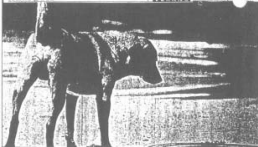
Los perros que no son de casa lo suelen tener más triste.