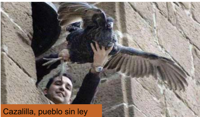
Cazalilla, pueblo sin ley

El SEPRONA denuncia que la opacidad de la ley favorece organizar con impunidad peleas de gallos en Andalucía. Los agentes de la Guardia Civil también se preguntan cómo es posible que cada año se celebren campeonatos de la modalidad, con altos precios de entrada y premios en metálico, "si hablamos de tientas que tienen como única finalidad la mejora de la raza y la exportación". En el reglamento del evento de 2010, celebrado en Jerez, se establece una cuota de inscripción de 150 euros por gallera para premios que van de 1.500 a 6.000 euros. Los agentes de la Benemérita se sienten atados de pies y manos para enfrentarse a estas prácticas "irregulares", por lo que se han dirigido a la Fiscalía de Medio Ambiente, con el respaldo de un informe del Colegio de Veterinarios, para alertarle sobre las prácticas de las peñas y propiciar un cambio legislativo.