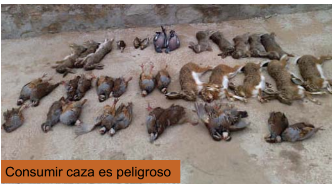
Consumir caza es peligroso