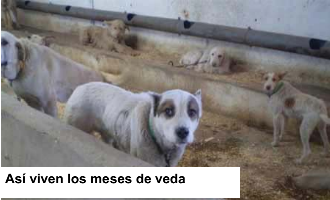
Así viven los meses de veda

Agricultura intenta que nuestro contencioso sea