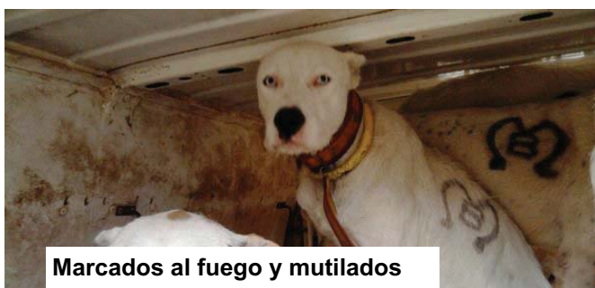
Marcados al fuego y mutilados

-Exentar a las perreras de rehalas de las obligaciones a que hace referencia el Capítulo IV de la Ley 11/2003.