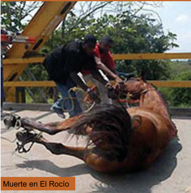
Muerte en El Rocío

De momento, hasta que nos lleguen las estadísticas oficiales, el número de equinos muertos en la Romería del Rocío asciende a 11.