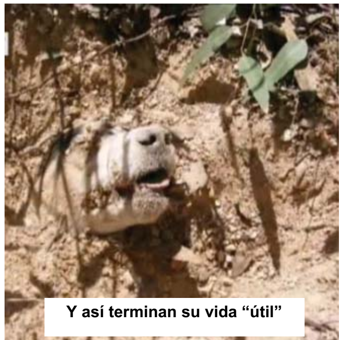
Y así terminan su vida “útil”