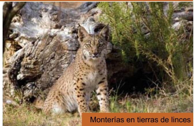
Monterías en tierras de lince

Los niños menores de seis años, las mujeres embarazadas o aquellas que planeen quedarse en estado no deben consumir carne procedente de animales cazados con munición de plomo, porque este metal afecta al sistema nervioso central en desarrollo, dice un informe del Comité Científico de la Agencia Española de Seguridad Alimentaria y Nutrición (Aesan), dependiente de Sanidad.