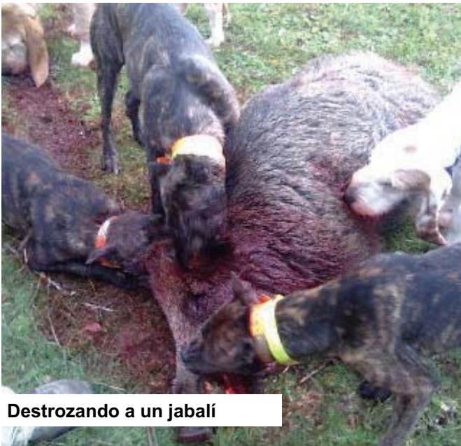
Destrozando a un jabalí

d) Que la correcta interpretación del art. 1 de la Ley 11/2003, de 24 de noviembre, de protección de los animales indica que los perros de rehala tienen la consideración de animales de renta.