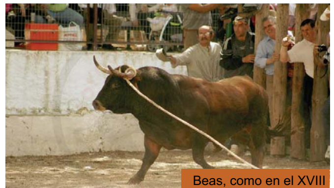
Beas, como en el XVIII

La Consejería de Agricultura se sigue mostrando incapaz de hacer cumplir la Ley. Como viene siendo habitual en los últimos años, Agricultura ha incoado un expediente sancionador contra la persona que arrojó una pava desde el campanario de la Parroquia de Santa María de la Magdalena del municipio jiennense de Cazalilla el pasado 3 de febrero, en el marco de las fiestas en honor a San Blas. Un individuo que deberá pagar 2.001 euros, la mínima sanción posible por la comisión de una infracción "muy grave". Los infractores, que conocen la pusilanimidad de Agricultura, se limitan a recolectar el importe de la multa entre los vecinos.