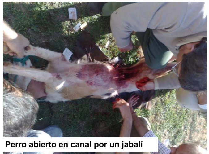
Perro abierto en canal por un jabalí

Por supuesto que en su enfrentamiento con los animales a cazar, mayormente jabalíes y ciervos, los perros sufren numerosas heridas e incluso la muerte, pues su "trabajo" es hacer presa en el animal perseguido y no soltarlo hasta que llega el cazador para rematarlo. Los perros de rehala tienen una vida "útil" bastante corta, y a los que llegan vivos al final de dicha vida desde luego no llegan vivos al final de su vida natural, pues perro que ya no sirve... Precisamente el lograr poner en evidencia cómo y cuándo terminan los perros de rehala su vida al "envejecer" es otro asunto que posiblemente podamos resolver a corto plazo, junto con el permiso tácito que "disfrutan" para poder seguir mutilando orejas y rabos a su animales.