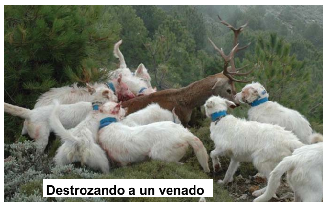
Destrozando a un venado

su contubernio. Gobernación se apresuró a pasar la patata caliente a Agricultura, y Agricultura, en octubre de 2007, se vio obligada a publicar una Circular de Interpretación estableciendo, entre otros asuntos que "Dado que la práctica de la caza, se trata de una actividad lúdica y deportiva, se entenderá a todos los efectos que no se traslada a los animales con ánimo de lucro cuando el titular de los perros acredite su pertenencia a alguna asociación o federación relacionada con la actividad cinegética. En estos casos, no será exigible la inscripción en el registro de Transportistas de Ganado al amparo de la exención prevista en el art. 2.2 a) del R.D. 751/2006".