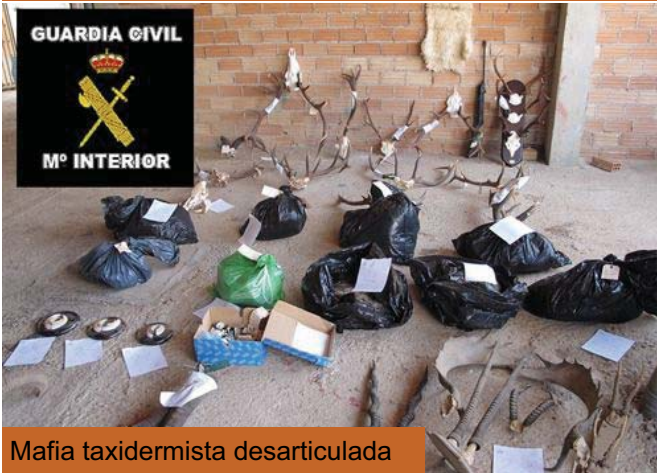
Mafia taxidermista desarticulada