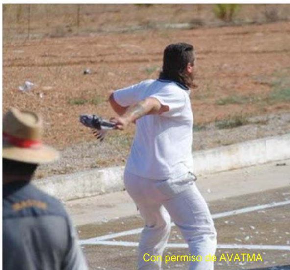
Con permiso de AVATMA

-El lanzamiento a brazo lo efectúa un "soltador" también conocido como colombaire , que utiliza una técnica parecida a la empleada por los lanzadores de disco: sujeta al pichón con una mano, echa el brazo hacia su espalda, gira su cuerpo sobre un pie rápidamente para dotar al lanzamiento de energía cinética, y lo lanza hacia el radio de muerte (así se llama la zona) o recinto. Como detalle anecdótico, los soltadores se dividen en diferentes categorías, según su pericia "En las pruebas de carácter internacional o nacional sólo podrán actuar soltadores de categoría PRIMERA."