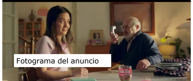
Fotograma del anuncio

Nos ha gustado el artículo de Eva Güimil comentando la que ha liado en las redes un anuncio de Nocilla que incluye un Satisfyer. Inmediatamente las huestes que ya conocemos iniciaron una campaña para boicotear a Nocilla por perturbar las mentes infantiles.