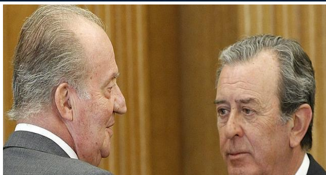
Los Hermanos Mayores de la Hermandad caballeresca: el Rey y el Marqués de Puebla de Cazalla

Días después, el 9 de septiembre, recibía oficialmente, para confirmar su apoyo a la tauromaquia, a la Junta de Gobierno de la Real Maestranza de Caballería de Sevilla, de la que es Hermano Mayor y que está formada por “descendientes de la antigua nobleza del reino de Sevilla” que se declaren “católicos, apostólicos y romanos” (los entrecorillados son sic).