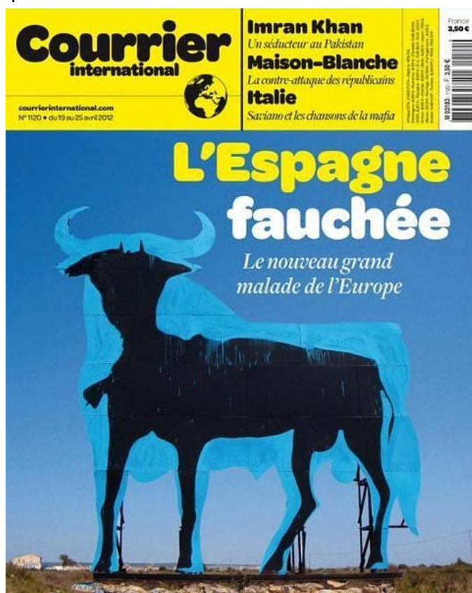
Portada de «Courrier» (19 de abril de 2012)

escuálido que a duras penas se sostiene ya en pie».