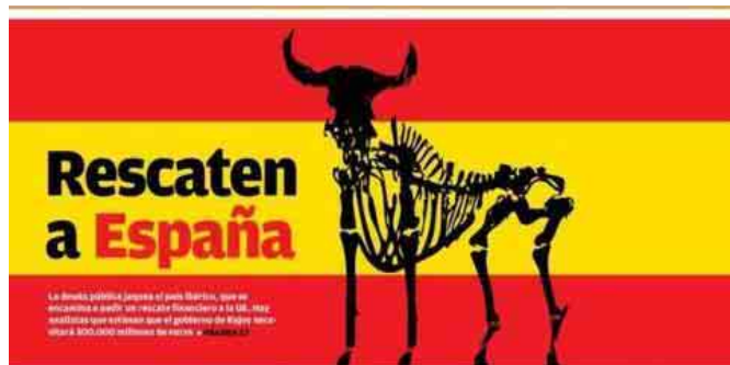
Portada de «El Observador» (25 de julio de 2012)

Un ejemplo más: el diario uruguayo «El Observador». En una portada publicada en septiembre titulaba: «Rescaten a España». De fondo lucía la bandera rojigualda y el esqueleto de un toro. Ni famélico ni con banderillas: un esqueleto. «La deuda pública jaquea el país ibérico, que se encamina a pedir un rescate financiero a la UE», añadía la información.