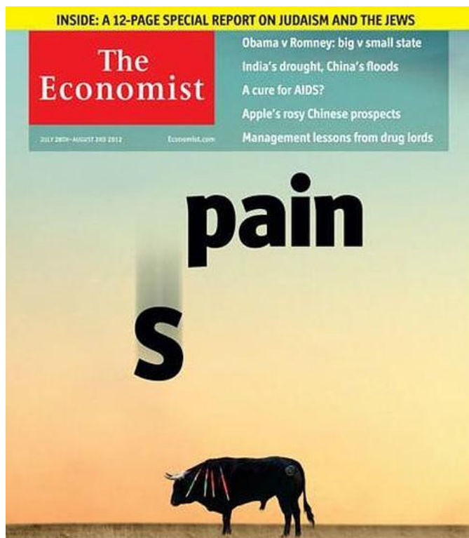
Portada de «The Economist» (28-07-2012)