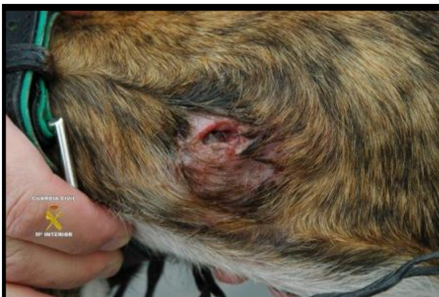
Galgo con el cuello rajado para extraerle el microchip

En resumen, o además de los dos veterinarios pillados hay algún otro que se dedica a cobrar por implantar microchips y no los da de alta para quedarse con todos los beneficios; o hay un mercado de microchips falsos que los implantan los mismos dueños simplemente para pasar los controles de la guardia civil durante las cacerías... Pero nada de eso parece preocupar ni a la Administración ni al RAIA.