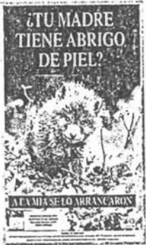
Carteles para fomentar un trato digno a los animales

Procuramos involucrar en las campañas a los organismos públicos competentes en la materia. Así hemos conseguido ya que el Ayuntamiento de Sevilla adopte algunas medidas importantes y persiga la venta ilegal de animales en el mer-