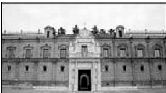
El Parlamento Andaluz, siempre de brazos caídos en temas animalistas.

Pues bien, se cumplió el segundo plazo, el de doce meses, en el que deberían haberse promulgado los distintos reglamentos que podrían dar efectividad a algunos aspectos de la Ley y, de nuevo, por supuesto, el Gobierno no ha cumplido ni una de sus obligaciones. Así que, en cuanto se cumplió el plazo, dirigimos una nueva Pregunta de Iniciativa Ciudadana al Consejo de Gobierno del Parlamento de Andalucía interesándonos por las razones del incumplimiento y preguntando si tenían prevista alguna otra fecha para cumplir con sus obligaciones. Hasta el momento no nos han contestado, pero es que, en estas fechas están con los asuntos de los sueldos de sus jubilaciones y demás, por lo que, en breve, esperamos alguna noticia.