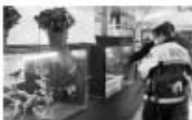
CLAUSTRADA. Un policía local observa uno de los reptiles expuestos en Plaza de Armas, ayer por la tarde.