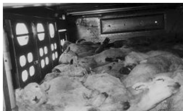
CORDEROS MUERTOS POR ASFIXIA DURANTE TRANSPORTE

El día 11, varios periódicos publican la nota de prensa y, seguidamente, declaraciones del alcalde de Algeciras al respecto: niega haber recibido solicitud alguna para autorizar la fiesta, mucho menos haberla autorizado y, por supuesto, ni intención de autorizarla ¡! Una hilarante historia si no fuera por su fondo.