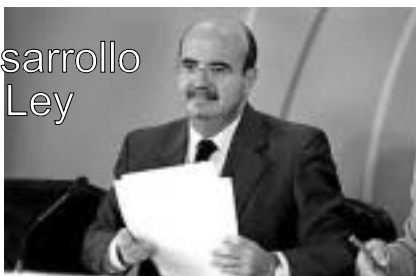
El Consejero de Presidencia

denominada Ley andaluza de Protección de los Animales debería haber sido desarrollada a través de no menos de 16 reglamentos. Como era de esperar, tal desarrollo no se ha producido y ya en septiembre de 2005 presentamos, ante el Defensor del Pueblo Andaluz una queja contra el Consejo de Gobierno de la Junta. De entonces acá el Defensor ha intentado en vano obtener información al respecto, por lo que, finalmente, a finales de mayo, tuvo que formular una advertencia formal al Consejero de Presidencia. Eso significa que, de continuar sin dar explicaciones sobre las causas por las que no cumple con los plazos de desarrollo de la Ley, el Consejero de Presidencia podrá ser declarado como hostil y entorpecedor de las funciones de la Institución.