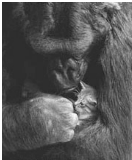
Koko y All Ball