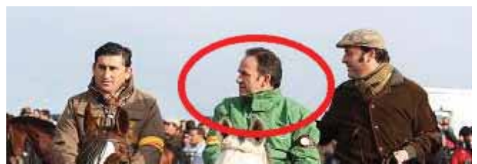
El Secretario de la Diputación en una actividad galguera

Por ello hemos puesto los hechos en conocimiento del Juzgado ya que podrían ser constitutivos del tipo delictivo previsto en el art. 441 del C.P. dado que el denunciado pudiera haber realizado una actividad profesional o un cargo técnico como Comisario en un asunto en el que ha intervenido, por razón de su cargo, celebrando desde el año 2000 convenios de colaboración con la Federación Andaluza de Galgos, que ha recibido subvenciones derivadas de asuntos tramitados, resueltos e informados en la Diputación Provincial de Sevilla por esa Secretaria General donde ejerce sus funciones el denunciado.