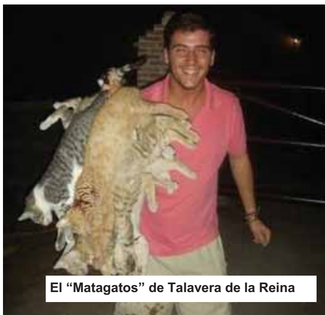
El "Matagatos" de Talavera de la Reina

En resumen, queda mucho camino por andar en el ámbito de la protección penal de los derechos de los animales, pero comienzan ahora a recogerse los frutos de largos años clamando contra la impunidad de quienes atentan contra la vida o la integridad de nuestros compañeros de planeta.