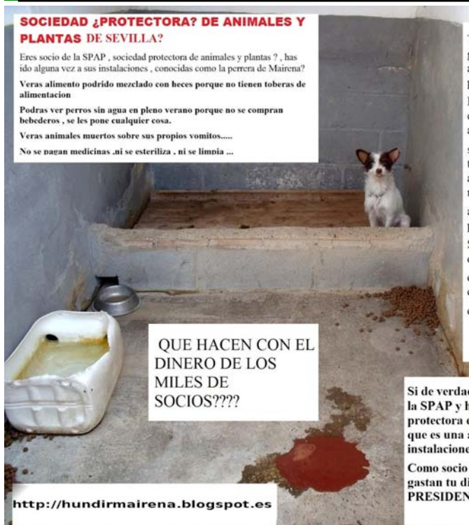
(Viene de la página 1)

hechos, sólo una de ellas concluyó en sanción, dos aún están inconclusas y el resto fueron archivadas con fundamentos de lo más escandalosos. A lo largo de estos años no hemos podido sino convencernos de la perfecta estructura tejida por los responsables de la sociedad para salir sin mayores problemas de cualquier acción legal de denuncia.