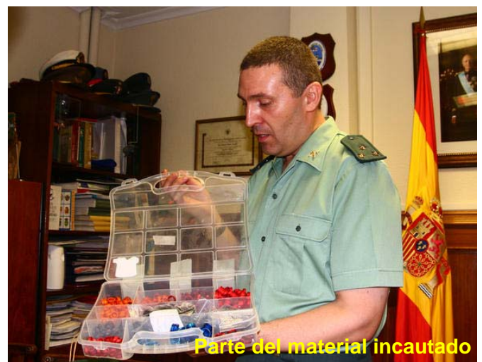
Parte del material incautado

También fueron intervenidas cuentas bancarias; un elevado número de documentos de cesión de aves rapaces; cuadernos de seguimientos de campo con localización de nidos de rapaces; una bolsa de deporte con material de escalada; 12 trampas para aves; 10 huevos sin fertilizar; una caja con material para inseminación: una incubadora en funcionamiento con dos huevos; ocho ordenadores; un teléfono móvil; y diverso material quirúrgico.