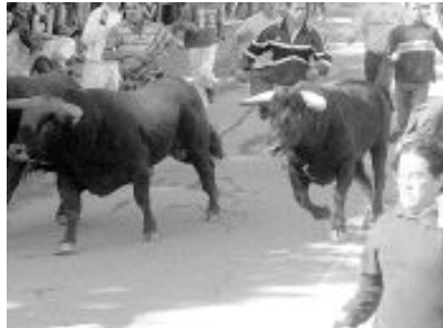
Uno de los encierros de Cuéllar a su paso por las calles de la localidad.

Unas 15 personas representantes de colectivos taurinos de la localidad francesa acudirán a la cita.