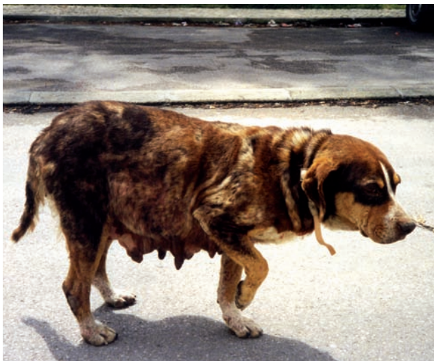
Perro callejero en Portugal.

Habrán asuntos de bienestar relacionados tanto con los perros que tienen sus movimientos restringidos como con los vagabundos/callejeros; sin embargo, para los propósitos de este documento, el objetivo del manejo de poblaciones caninas está definido así: "Manejar las poblaciones callejeras de perros y los riesgos que éstas pueden representar, incluyendo la reducción de la densidad de la población cuando se considere necesario."