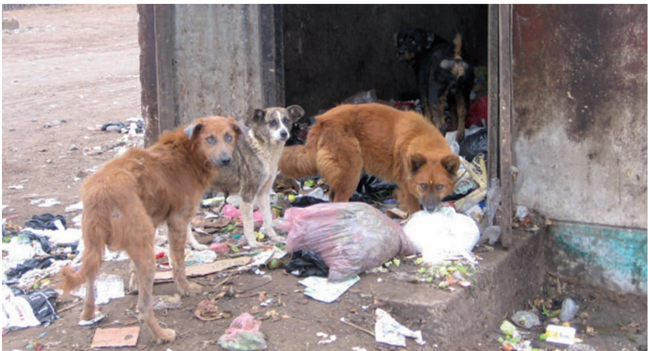
Perros callejeros en Perú alimentándose con basura.