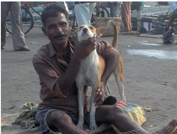
Pescador y perro de la comunidad en India.