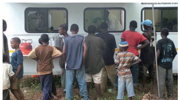
Ciudadanos locales observando los procedimientos de esterilización a través de las ventanas de una clínica móvil en Zanzíbar.

En 2006, hubo una situación similar en Zanzíbar cuando WSPA y el gobierno local introdujeron una intervención de esterilización. Empezó con poca conformidad, con pocos dueños dispuestos a llevar sus animales para un procedimiento de esterilización; sin embargo, después de un período, las actividades de educación, las discusiones con los líderes de la comunidad y los ejemplos reales de animales esterilizados saludables empezaron a crear un cambio en las actitudes humanas, llevando a las personas a buscar activamente la esterilización para sus animales.