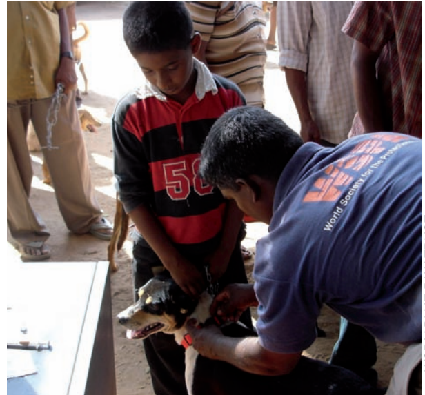
WSPA BLUE PAW TRUST