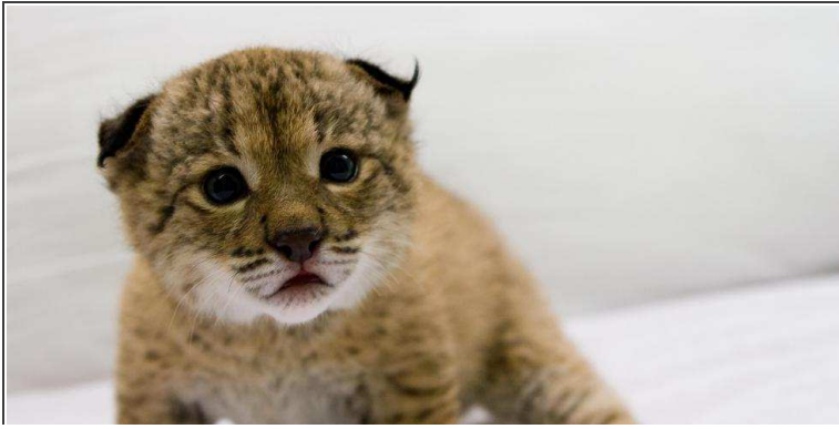
Programa de conservación ex-situ del lince ibérico