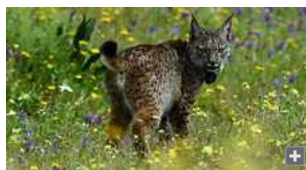
Un ejemplar de lince ibérico en libertad.