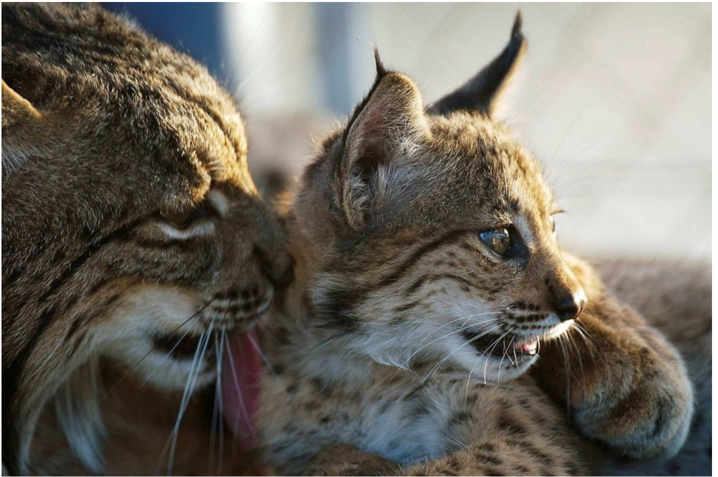
Linces Sali y Brezo El Acebuche