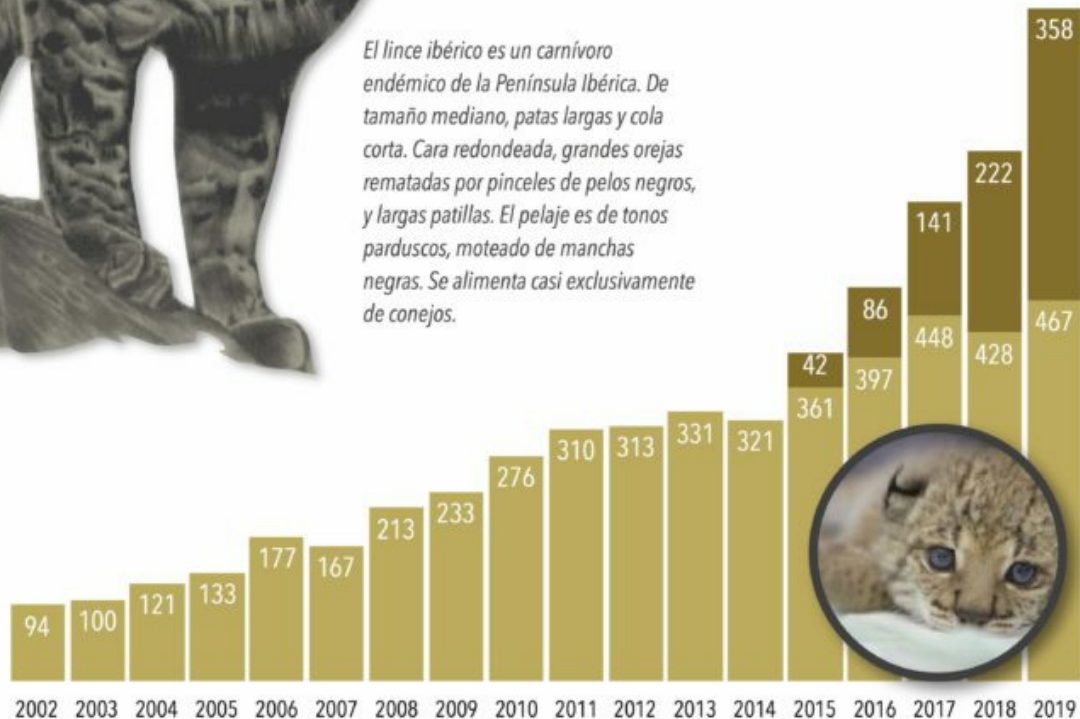
Población de lince por año en la Península Ibérica

El lince ibérico es un carnívoro endémico de la Península Ibérica. De tamaño mediano, patas largas y cola corta. Cara redondeada, grandes orejas rematadas por pinceles de pelos negros, y largas patillas. El pelaje es de tonos parduscos, moteado de manchas negras. Se alimenta casi exclusivamente de conejos.