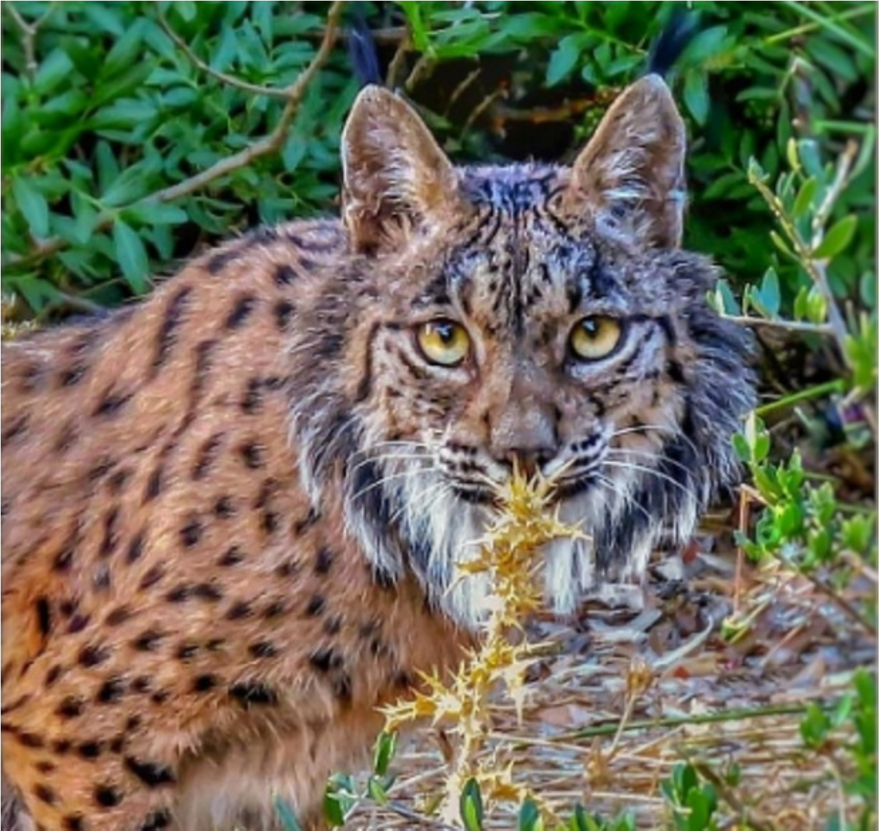
Un lince ibérico sorprendido por la cámara.

Afortunadamente, el lince ibérico parece que empieza a remontar. Hay que tener en cuenta que, en 2013, se calculaba que solo quedaban dos poblaciones en Andalucía aisladas entre sí con un total de algo más de trescientos individuos, más otra en los Montes de Toledo de unos quince individuos. Por ello, era (y aún es) la especie de felinos más amenazada del mundo.