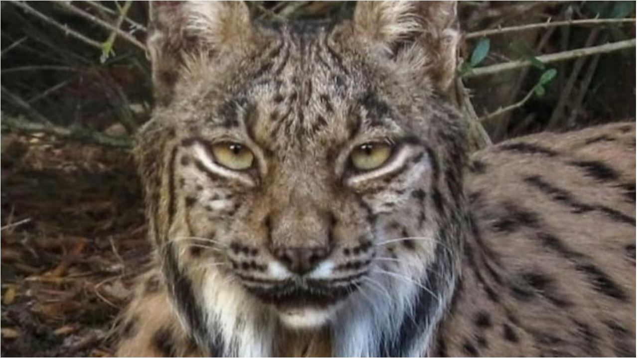
Retrato del lince. (José Luis Lázaro Calvo / JLLC)