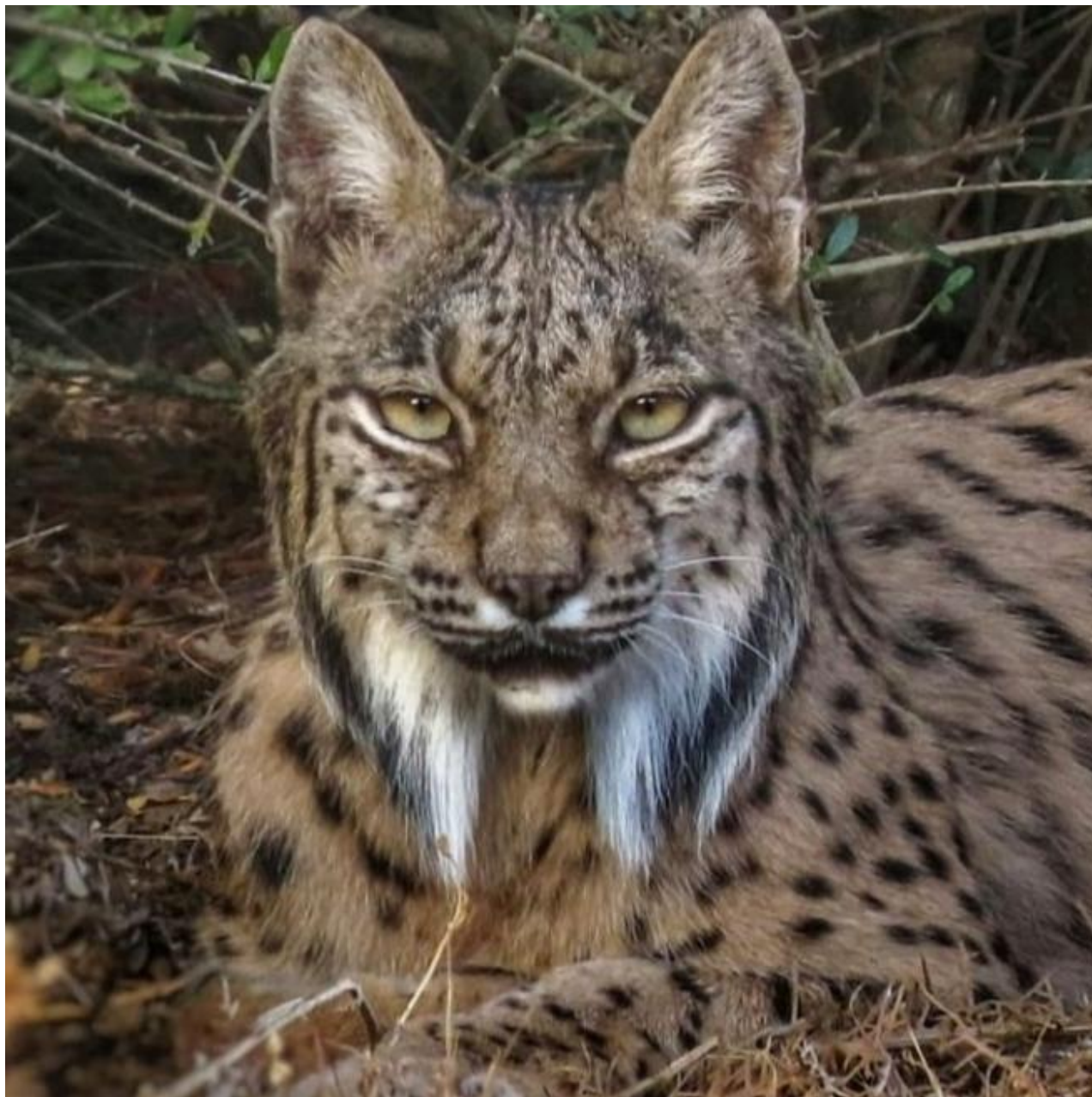
El lince, con su aspecto característico.

Es un ágil cazador. Se aproxima sigilosamente a la presa y salta sobre ella con rapidez. Menos frecuentemente espera oculto a que pase una presa.