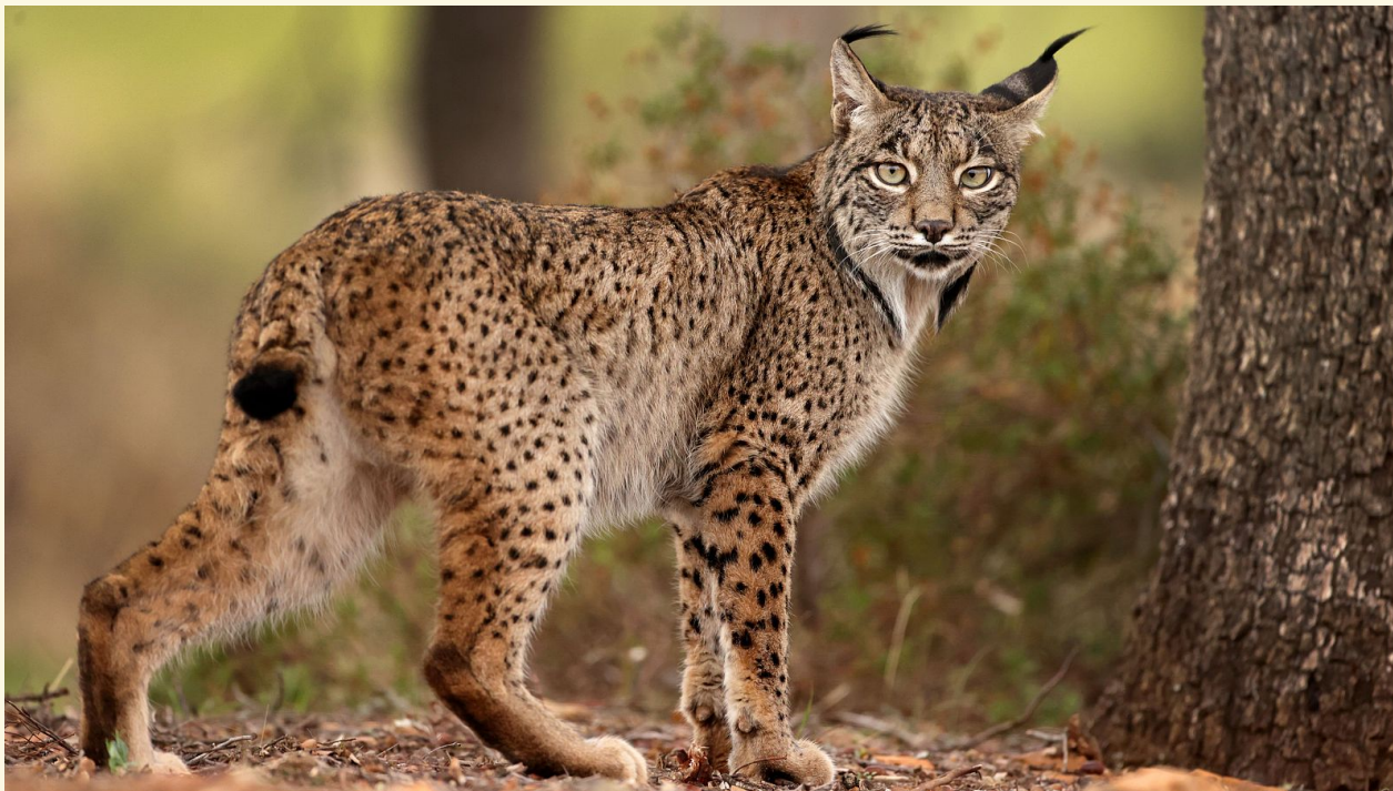
Ejemplar de lince ibérico en Castilla-La Mancha.