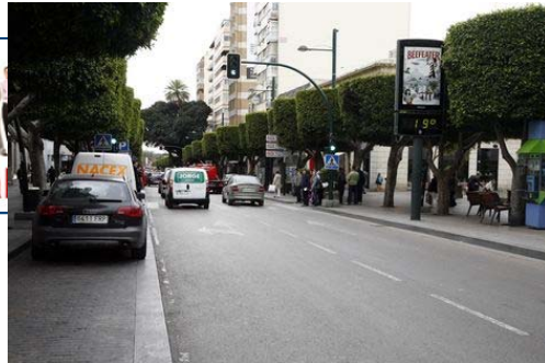
La calidad del aire fue admisible el 92% de los días durante 2010