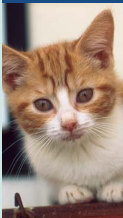
ABAJO:Gatito en el centro para animales de la RSPCA