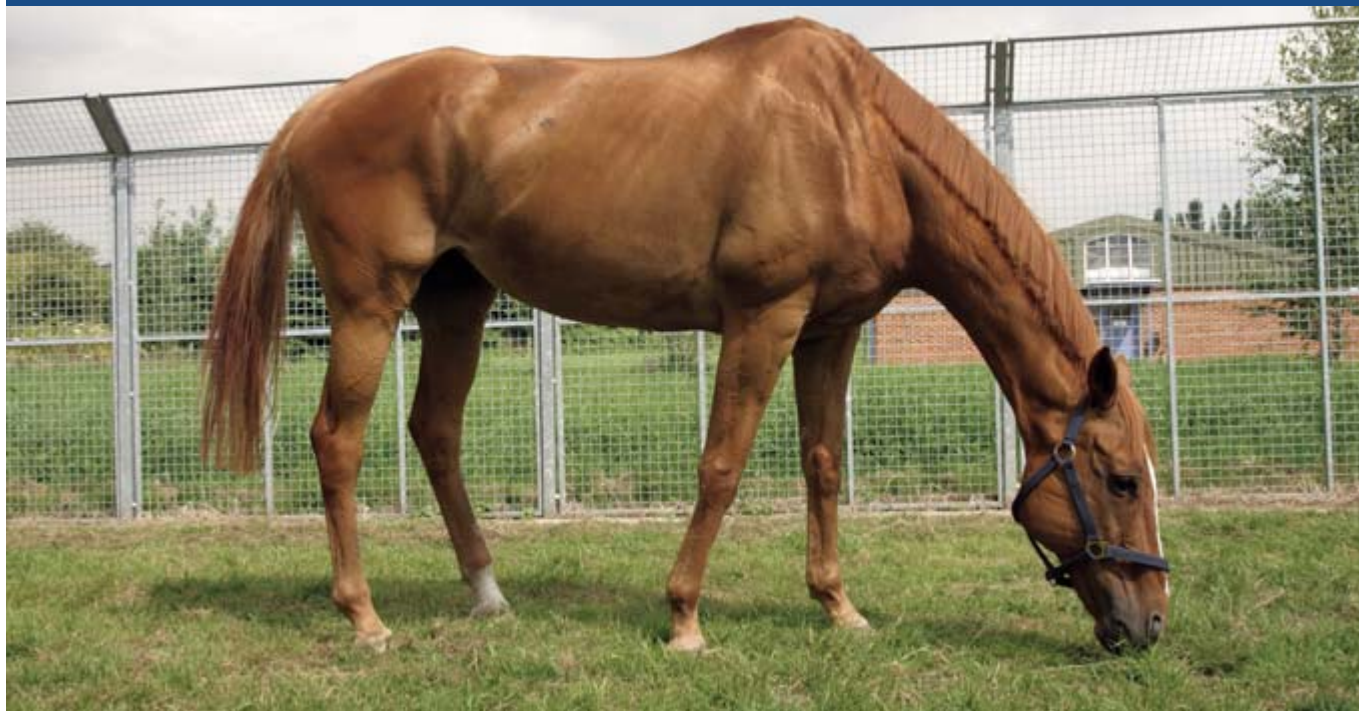
Caballo en el centro de la RSPCA

La mayoría de los albergues reciben una cantidad de animales pequeños, además de perros y gatos. Un bloque multipropósito puede ser construido, pero tenga en cuenta que como no es una unidad especializada, la estadía de estos animales debe ser tan corta como sea posible. Usted debería tratar de evitar alojar estos animales identificando a personas que estén preparadas para darles un hogar temporal hasta que sean adoptados. Las mismas condiciones de hogares temporales deberían ser adoptadas para los animales grandes. El bloque de los animales pequeños deberá ser equipado con comida y equipo apropiados, por ejemplo: jaulas.