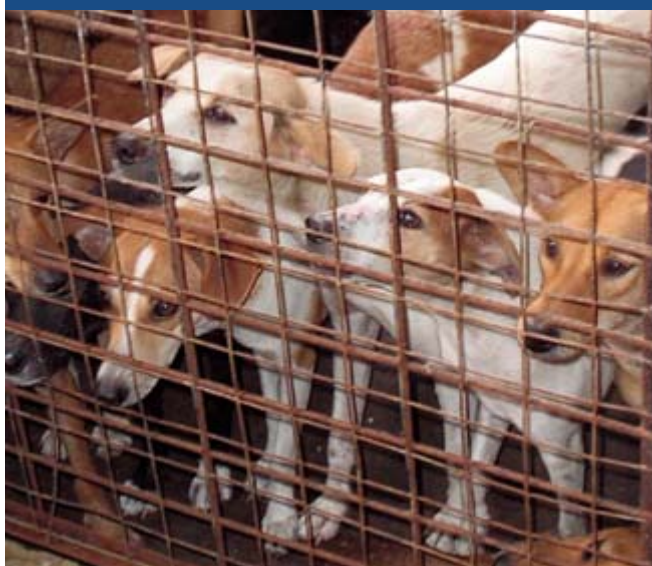
Perrera con condiciones de hacinamiento

Puede ser que, después de la evaluación, construir un albergue no sea la manera en la que a usted le será posible ayudar a la mayor cantidad de animales.