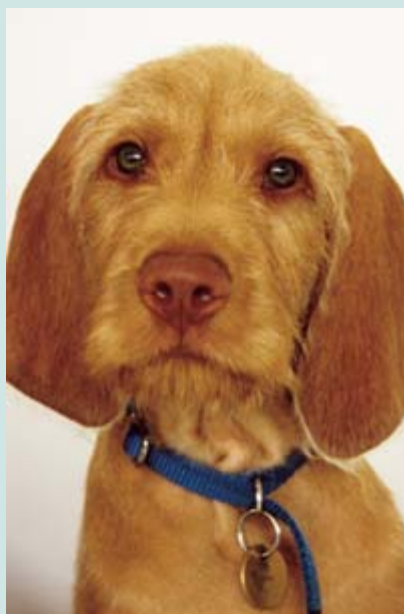
ARRIBA:Vizsla Húngaro pelo de alambre